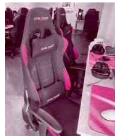
疲れにくいゲーミングチェア