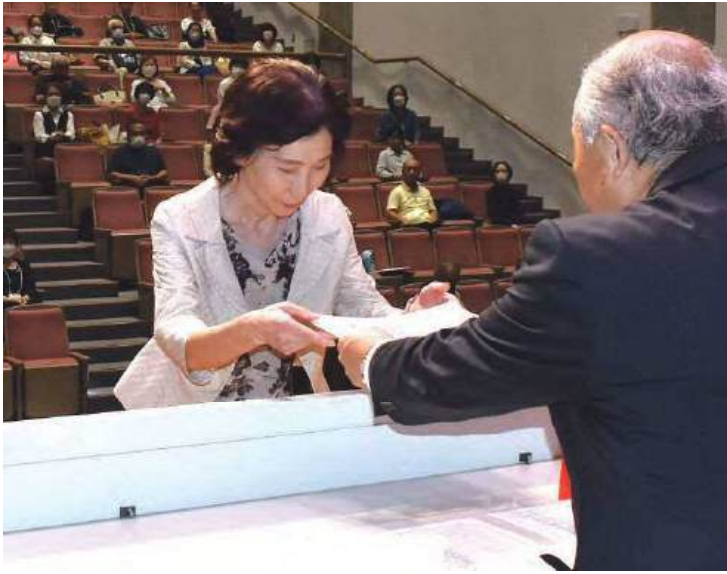
新潟 壇上で一人一人に修了証書を授与＝9月26日