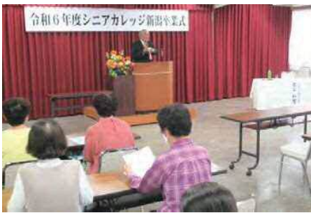
上越 卒業生に石上学長が語り掛ける＝10月15日