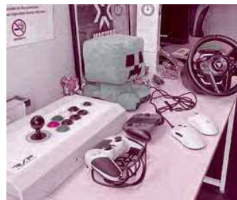
ゲームのコントローラーはさまざま