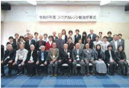
長岡 晴れやかにみんな一緒にの卒業写真＝10月30日