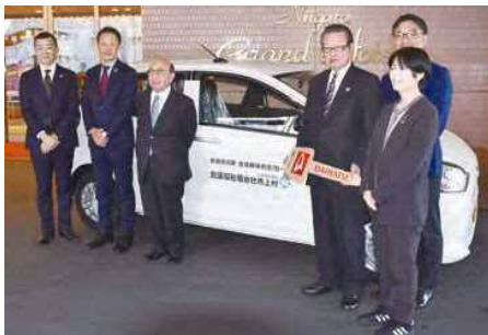
村上市社協へ贈られる福祉巡回車の前で記念撮影

援を続けています。今年度、寄付するのは備品購入費のほか、物品としては村上市社会福祉協議会への福祉巡回車1台をはじめ、自動体外式除細動器（AED）、シャワー用車いす、安心ネット付き大型扇風機、ジュニアチャイルドシートなどです。