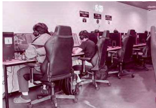
高性能なゲーミングパソコンが充実している「長岡eスポーツクラブ」の施設内。若者を中心に子どもから高齢者までゲームを通じた交流を楽しんでいる

日本では、1970年代から80年代にかけてゲームセンターや家庭用ゲーム機が普及しましたが、「ゲームばかりして勉強をしない」など、ゲームには少なからずネガティブなイメージがありました。やがてインターネットが普及し、2000年代に入ってから「eスポーツ」という言葉が使われ始めます。ゲームの競技性に、より焦点が当たり、世界各地でオンラインゲーム大会が開催されるようになりました。日本でも2018年にeスポーツの普及と発展を目指すeスポーツ連盟が設立され、今では教育や福祉、地域づくりでの活用も広がっています。