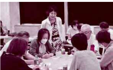
「高齢者のストレスと予防・対策」