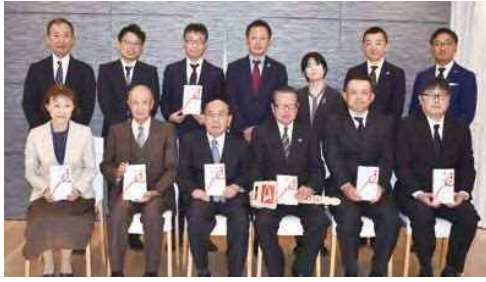
助成金贈呈を終え記念撮影する生命保険協会県協会の役員らと寄付を受けた団体の代表ら