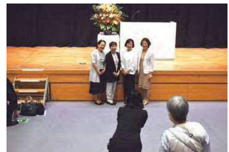
会場の卒業生 思い出に級友と記念写真＝9月26日

その後、新潟会場では石上学長は式辞として「2年間、学んで卒業する皆さんは今後、地域で活躍し、何らかの形で地域に還元して