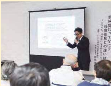
「家族信託 任意後見との違い」セミナー

3セミナーとも専門医や司法書士、公認会計士の専門職が講師で、市民らに分かりやすく解説しました。