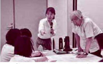
「他国の文化にふれる～韓国」