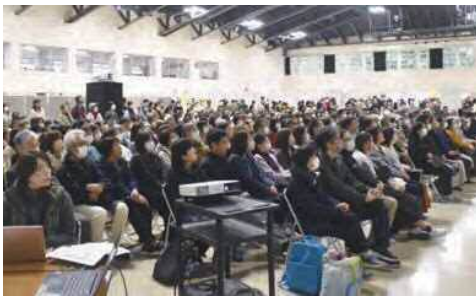
大入りの満席となり、立ち見客が続出したメインステージの講演会(写真④)。「さをり織り」体験会(写真右⑤)と、にぎわった「農福マルシェ」(写真右⑥)