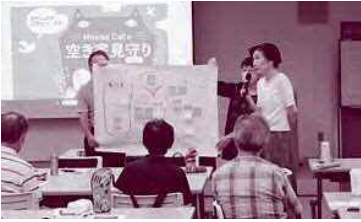
「障がい者の「働く」どう可能になったか」