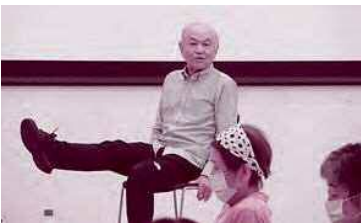
「転倒予防、認知症防ぐエクササイズ」