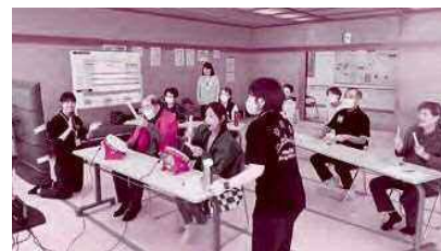
eスポーツ体験会の様子=高齢者センターみやうち