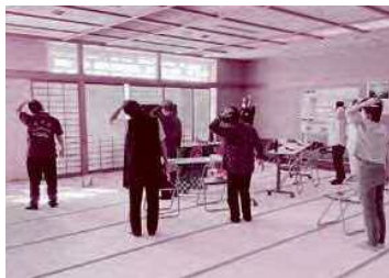
プレイ前に軽く準備体操を行う=長岡市主催のeスポーツ体験会

また、「無料」と表示されているゲームでも、プレイを進めると課金を促される場合があります。課金をせずにプレイできるゲームもたくさんあります。クレジットカード情報の管理には十分気を付け、不安を感じたら、家族や信頼できる人に相談してください。