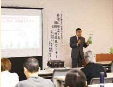
「終活に役立てる相続・相続税」セミナー

11月10日の「福祉・介護・健康フェア in 長岡」は長岡市の新潟日報長岡支社「メディアあらと」でセ